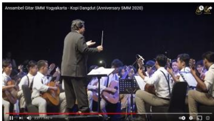
Gambar 14.1 Tangkapan Layar Video Musik Ansambel Gitar