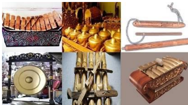
Gambar 14.10 Alat Musik Idiophone