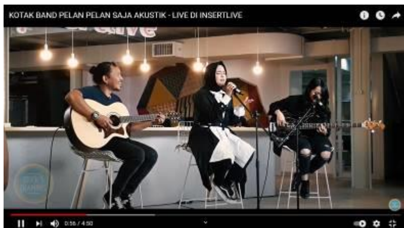
Gambar 14.3 Tangkapan Layar Video Musik Akustik