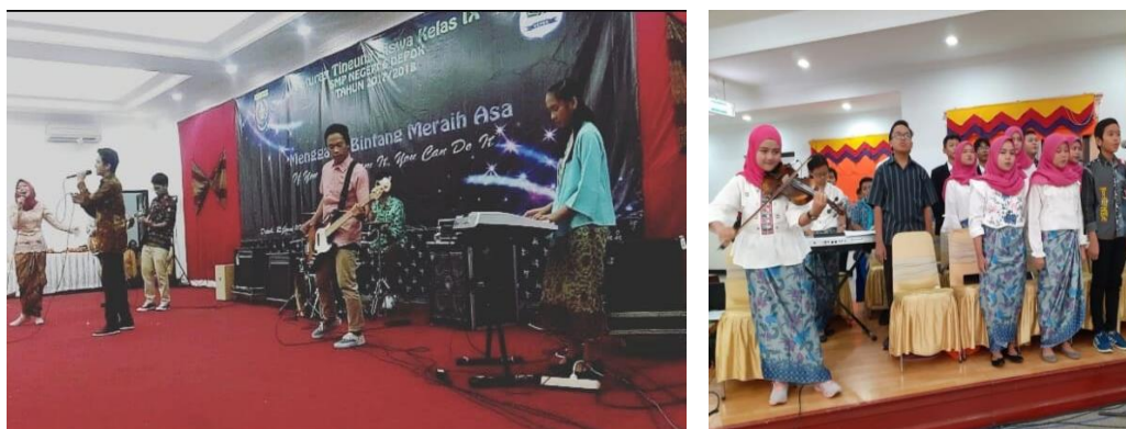
Gambar 14.5 Pertunjukan Seni Sekolah Indoor