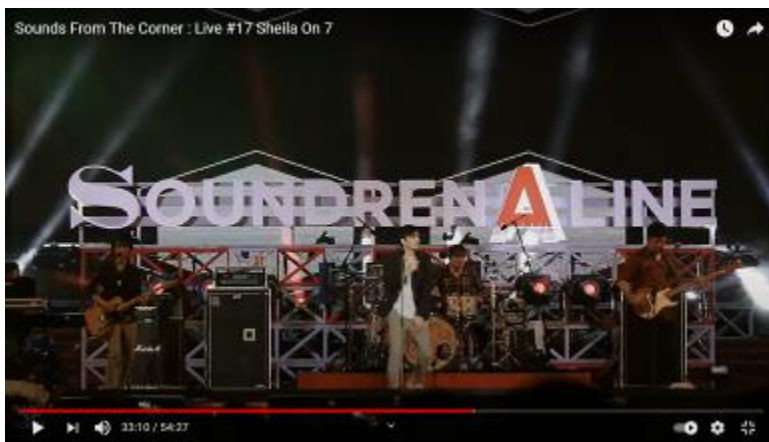
Gambar 14.2 Tangkapan Layar Video Musik Band