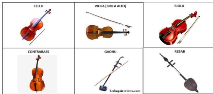
Gambar 14.8 Alat Musik Chordophone (digesek)

Contoh (digesek) : cello gesek, contra bas, biola, rebab.