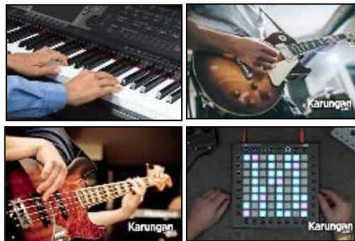
Gambar 14.12 Alat Musik Electrophone