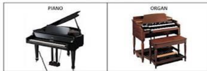
Gambar 14.9 Alat Musik Chordophone (ditekan)

Contoh (ditekan) : piano akustik, dan organ.