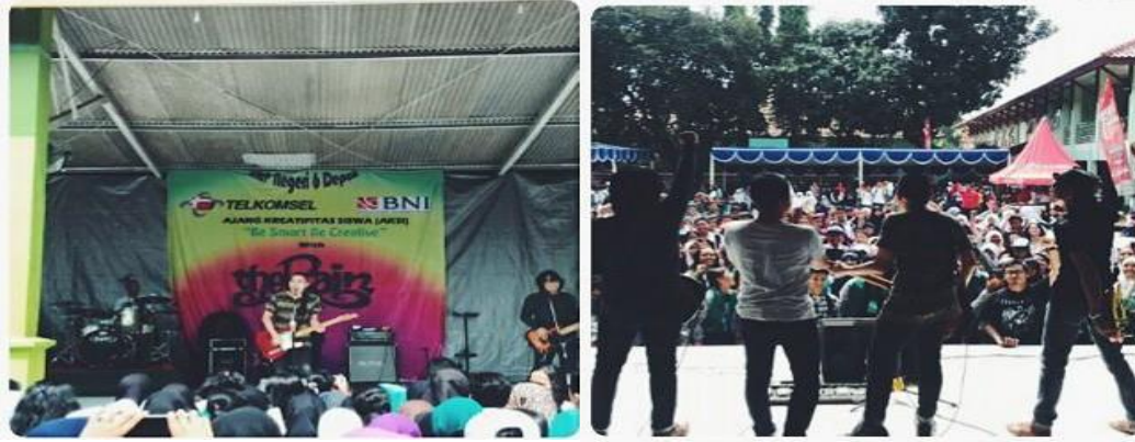
Gambar 14.4 Pertunjukan Seni Sekolah Outdoor

Contoh pertunjukan musik outdoor dan indoor