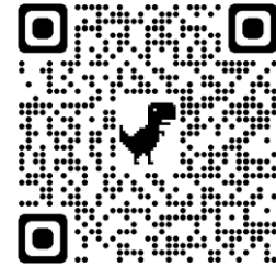
Sumber: dokumentasi pribadi https://www.youtube.com/watch?v=x6a6ABkhaVw