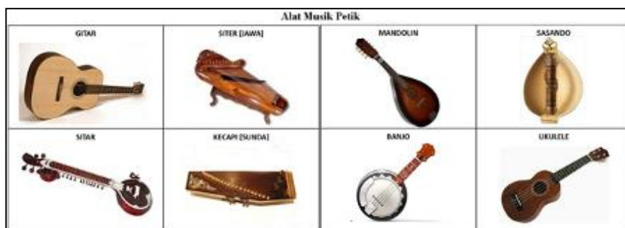
Gambar 14.7 Alat Musik Chordophone (dipetik)