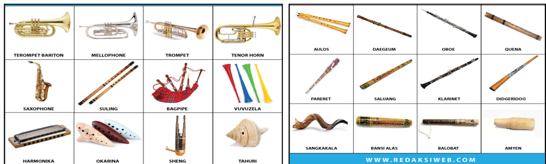
Gambar 14.6 Alat Musik Aerophone