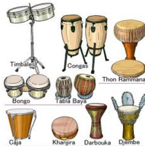
Gambar 14.11 Alat Musik Membranophone