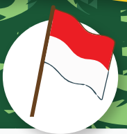
Bendera merah putih