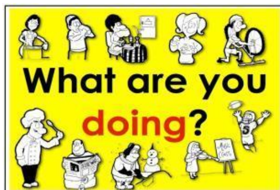
Gambar 6.1 What are you doing?

Pada awal pelajaran ini, Ananda perhatikan tulisan diatas ' What are you doing? '. Adakah yang dapat menjawab pertanyaan tersebut? Benar sekali jawabannya ' I'm studying English '. Pertanyaan di atas maknanya 'Apa yang sedang kamu kerjakan?', maka jawaban Ananda 'Saya sedang belajar bahasa Inggris' dalam bahasa Inggrisnya ' I'm studying English '.