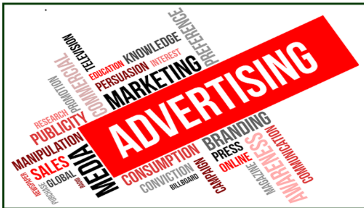
Gambar 10.2 Advertising Words

Find some words in the box below that are usually found in advertisements, and match them with their meaning!