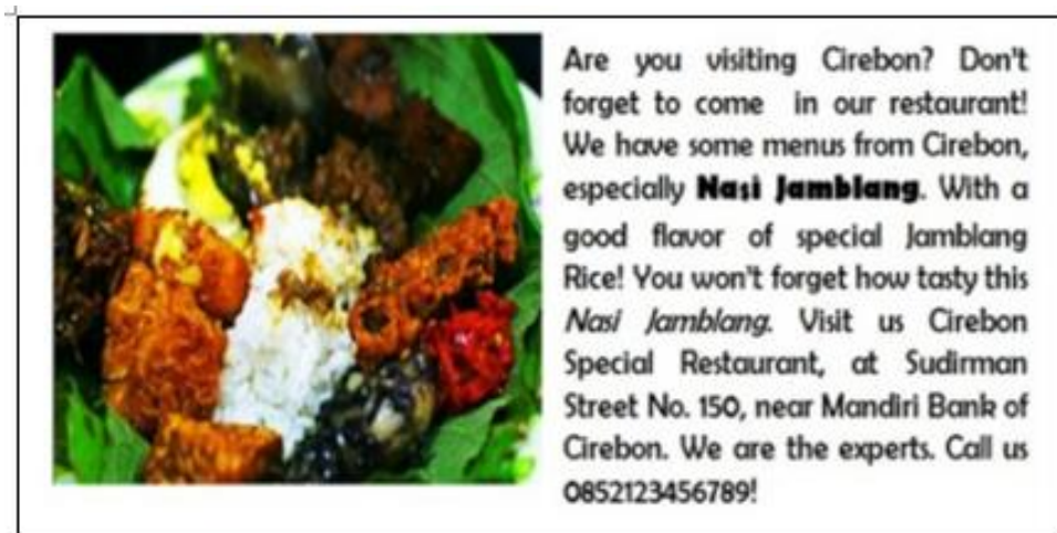
Gambar 10.1 Examples of Advertisements