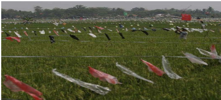
Gambar 1.3 Mengusir Burung di Sawah