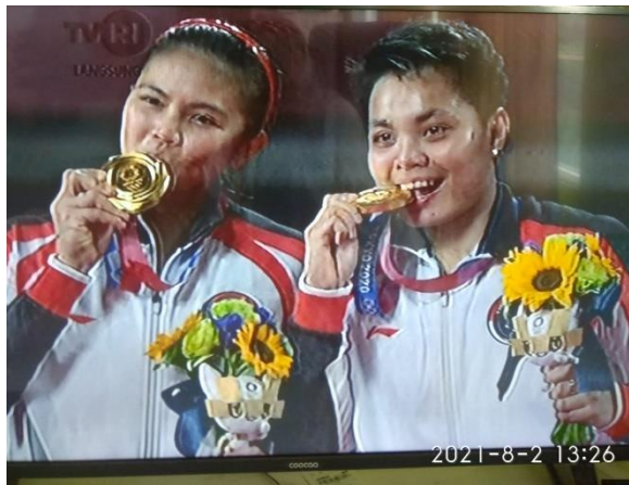
Gambar 1.5 Juara olimpiade badminton

There are pictures of happiness and achievement. Please write down the best expression for them.