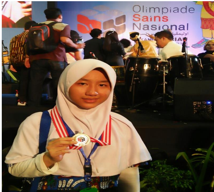
Gambar 1.7 Juara olimpiade sains