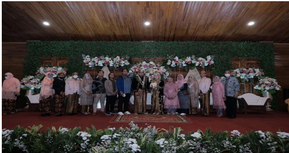
Gambar 1.6 Foto resepsi pernikahan