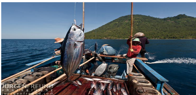
Gambar 1.4 Memancing Ikan